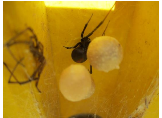
発見されたクモと卵囊