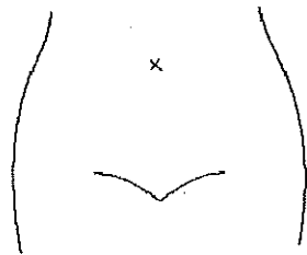
(腸瘻及びびらんの部位等を図示)