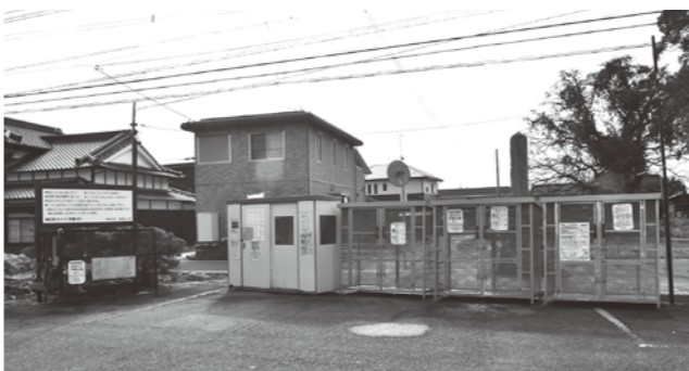
週2回のゴミステーション（横田地区）

Q 令和6年度に、東部環境施設組合の焼却炉が完成する。構成市町と同じ収集回数にすべきである。県内の市町の収集回数