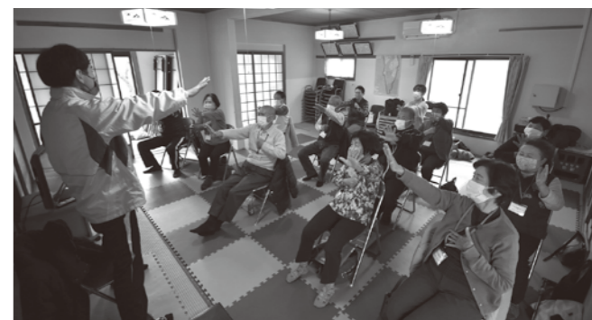
いきいき健康クラブ