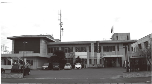
現在の築59年の三田川庁舎

A 答弁 財務協働課長 統合庁舎となった場合、財務協働課長 統合庁舎となった場合