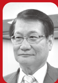
多良 光英 議員