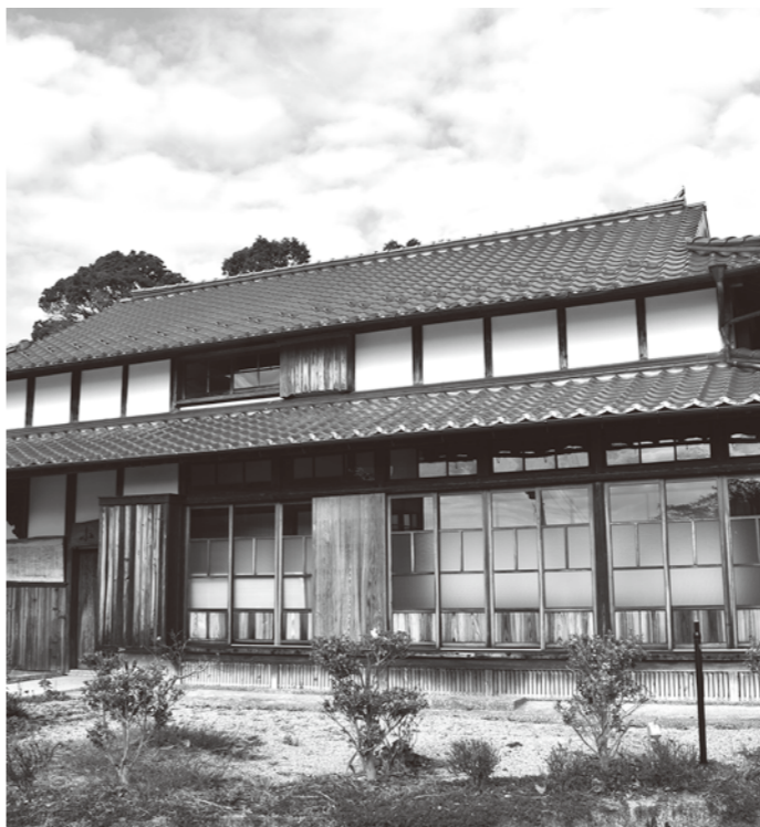
開業が待たれる古民家「小川内庵」

開業にあたっては、従業員の確保を行い、開業に向かって取り組んでいたが、令和2年コロナ感染症拡大の影響を受け、スタッフの確保ができず開業には至っていない。現在も町内の農産物を使用した郷土料理を提供する料理店として利活用