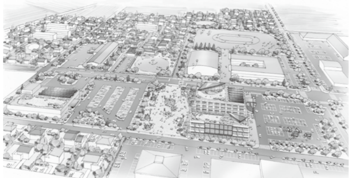
中心地づくり構想図

まないが、圃場整備したりっぱな農地をつぶさなければならぬ。しかし農業情勢が悪いので、付加価値のある土地にした