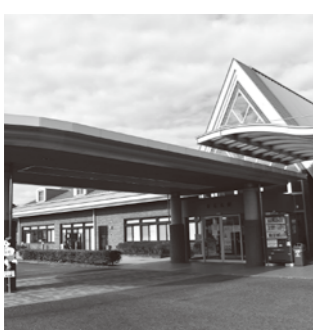
集団接種会場（きらら館）

A 答弁 こども・保健課長 5月以降は、各課からの係長級職員の派遣を受けワクチン接種計画などの業務を担ってもらう。一部の職員への負担が集中しないよう努めている。