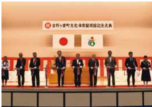
開館記念式典でテープカットをする佐賀県知事ほか関係者

故郷がダムに沈むことになった、小川内地区の皆様の協力を得て完成した五ヶ山ダムの振興基金を主な財源として完成したこの施設。式典で東脊振、三田川両中学校のブラスバンド部の素晴らしい演奏を響かせたとおり、社会体育だけでなく、文化活動においても高い機能を持つ施設となった。町内外から多くの方に利用され愛される施設となってほしい。