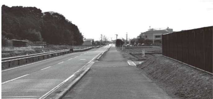
街路灯がなく真っ暗になる町道（横田クリーンセンター南）