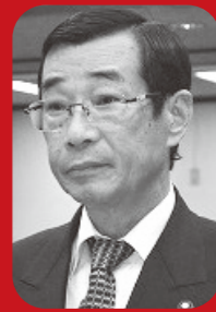
古川 勲 議員