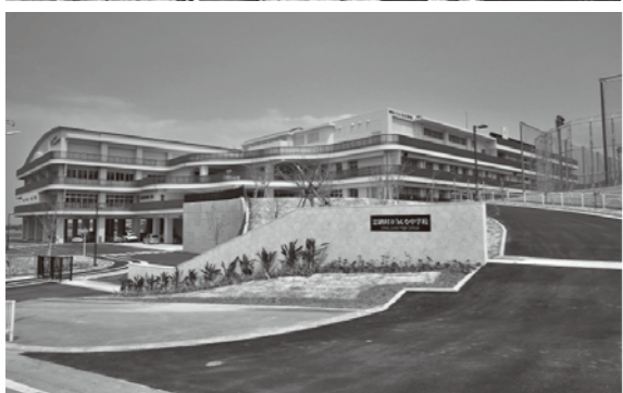
統合中学校については議会でも様々取り組んでいる。写真は視察した恩納村立うんな中学校

Q 建設事業課長 町道、宮民境界については全ての把握は出来ていないが、用地買収時は測量をして、境界がわかるようにしている。