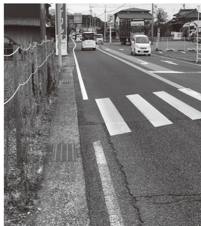
交差点に退避スペースがなく危険な箇所（国道34号）