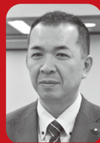
森田 浩文 議員