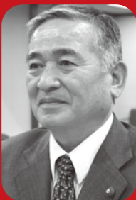
古川 輝英 議員