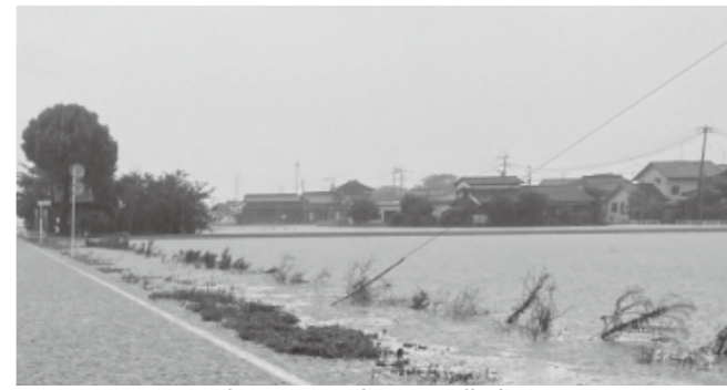
豪雨により水没した農地

A 答弁 産業振興課長 農業は、豪雨や台風などの自然災害における収量減少や市場価格の低下など、様々なリスクにさらされている産業である。新型コロナウイルスの影響により、外出自粛や外食産業時短営業による需要が減少しており、農業者の