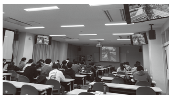
西九州大学の発達障害についての講義の様相 この大学でも奨学金を得て学業に励む生徒が多い

A 答弁 子ども・保健課長 「ノイエ」では制服等のお譲り会が好評で、さらに食品へも拡充できないか検討していく。