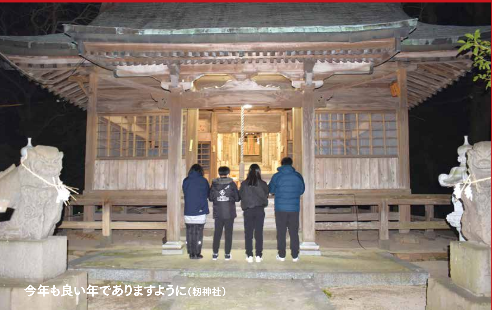
今年も良い年でありますように(初神社)