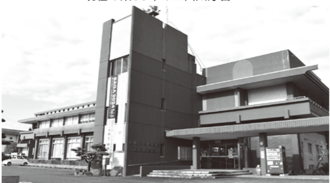
現在の築49年の東脊振庁舎

合、事務機能を1ヶ所に集約できると思うので、削減する方向で検討したいと考えている。