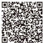
国民健康保険税 後期高齢者医療保険料

※国民健康保険税は世帯主が納税義務者ですが、実際に支払った人の控除に使用できます。