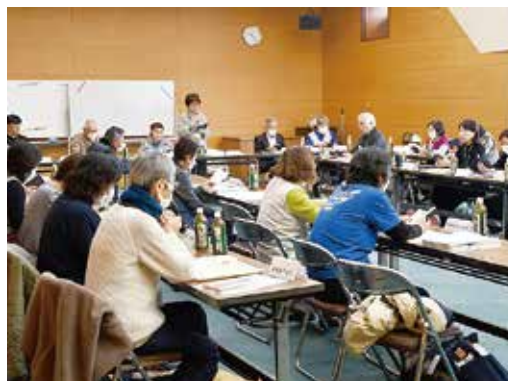
毎月12日に東脊振庁舎で開催される定例会の様子